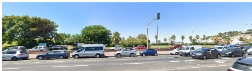
Figure 273. Vue de l'existant depuis l'avenue Georges Pompidou

Afin d'illustrer l'insertion paysagère du projet de stade nautique dans son environnement terrestre et maritime, l'étude d'impact fournit des photomontages selon quatre points de vue, depuis la corniche JF Kennedy jusqu'au Parc Balnéaire du Prado. Les nouveaux aménagements, en particulier la construction des cinq groupes d'immeubles du secteur sud, implique une modification du site visuellement importante.