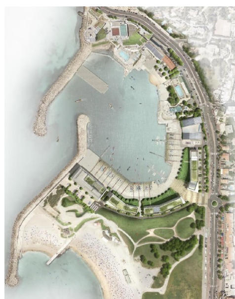
Figure 5: Plan de masse du projet en phase Héritage