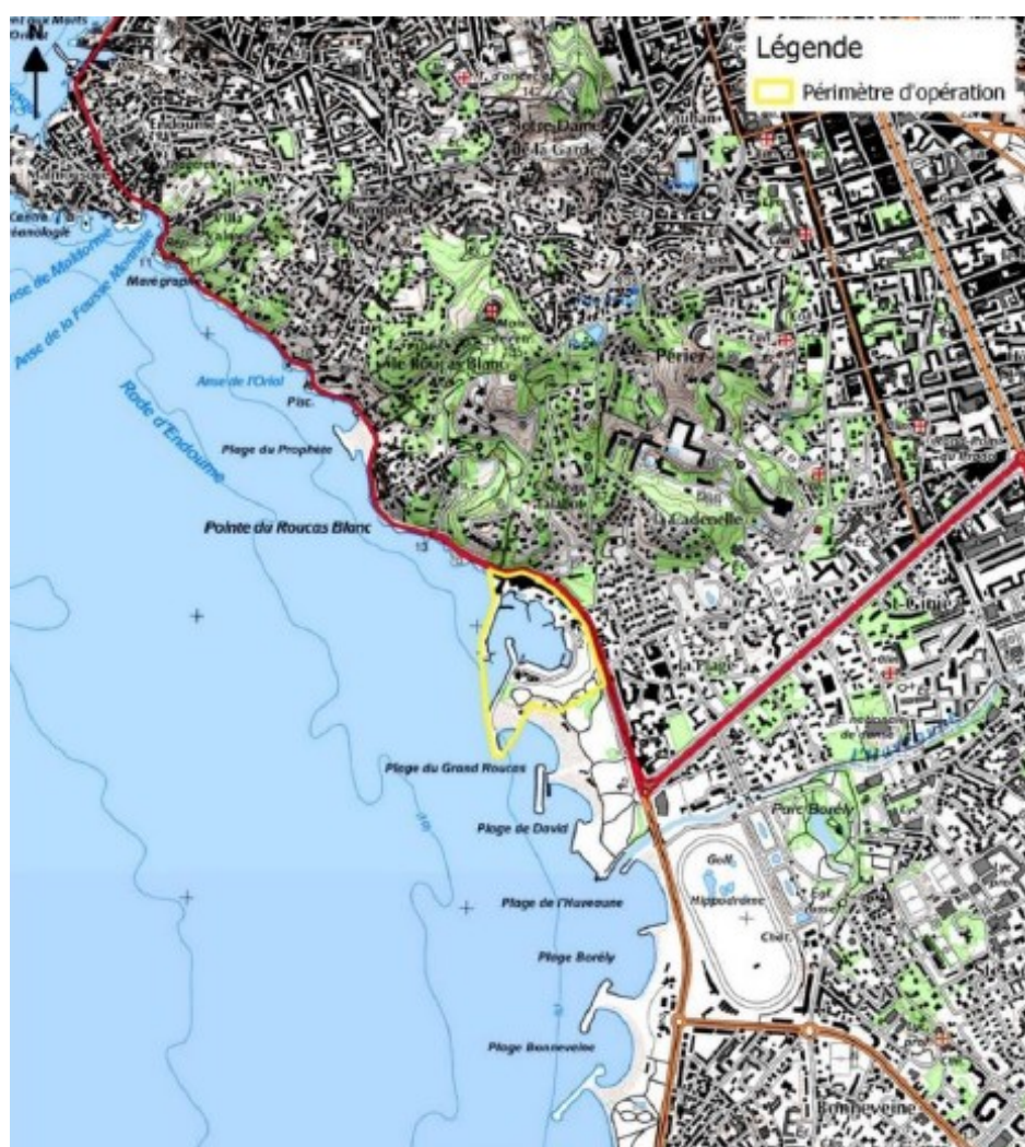
Figure 1: Plan de situation

Ce projet se situe au pied de la Corniche Kennedy, dans la rade sud de Marseille et au nord du parc balnéaire du Prado, au droit de la base nautique du Roucas Blanc.