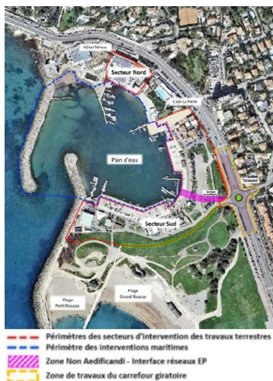
Figure 3: Aménagements actuels du stade nautique du Roucas Blanc

En phase Héritage, le stade nautique comprendra cinq groupes de bâtiments d hauteurs variables, le bâtiment le plus haut (trois étages) se situant à l'extrémité sud. Pour permettre le déroulement des jeux olympiques, ces aménagements feront l'objet d'adaptation en phase JO, afin d'offrir une organisation fonctionnelle des locaux et des espaces nécessaires à l'accueil de l'événement. Au sein de l'anse maritime, il est prévu l'installation de pontons flottants pour répondre aux besoins en capacité d'amarrage.