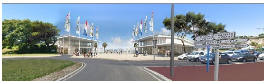
Figure 274. Vue en phase Héritage depuis l'avenue Georges Pompidou (Source : Le Fur Paysage, janvier 2021)

Figure 6: Vues depuis l'avenue Georges Pompidou (existant et phase Héritage - source : p.541 - EI)