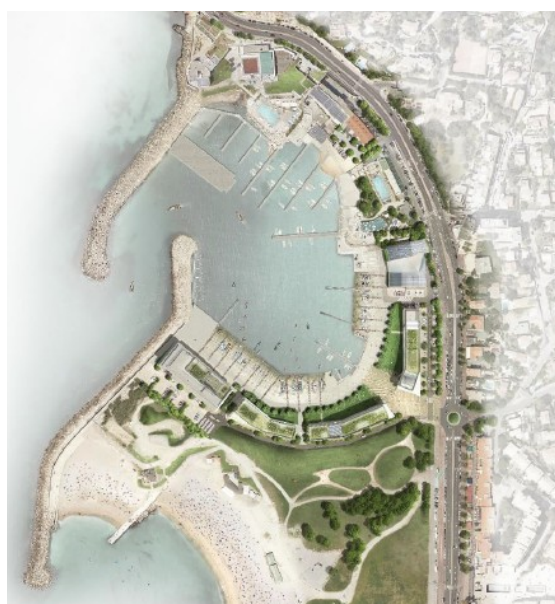
Figure 4: Plan de masse du projet en phase JO 2024

En phase Héritage, le stade nautique comprendra cinq groupes de bâtiments d hauteurs variables, le bâtiment le plus haut (trois étages) se situant à l'extrémité sud. Pour permettre le déroulement des jeux olympiques, ces aménagements feront l'objet d'adaptation en phase JO, afin d'offrir une organisation fonctionnelle des locaux et des espaces nécessaires à l'accueil de l'événement. Au sein de l'anse maritime, il est prévu l'installation de pontons flottants pour répondre aux besoins en capacité d'amarrage.